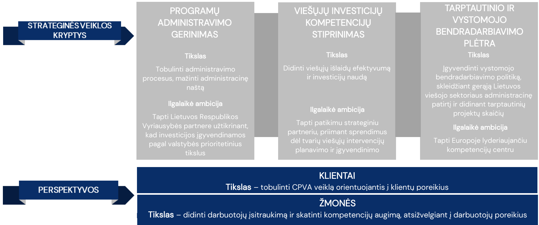
3 paveikslas. CPVA strateginės veiklos kryptys, perspektyvos ir tikslai

14. CPVA veiks šiomis strateginėmis veiklos kryptimis (3 paveikslas): programų administravimo gerinimas; viešųjų investicijų kompetencijų stiprinimas; tarptautinio ir vystomojo bendradarbiavimo plėtra. Šių strateginių krypčių įgyvendinimas paremtas CPVA veiklos tobulinimo perspektyvomis, orientuojantis į klientų ir darbuotojų poreikius. Strateginių veiklos krypčių ir perspektyvų uždaviniai, rodikliai, jų matavimo vienetai ir planuojamos reikšmės pateikiamos 1–5 lentelėse.