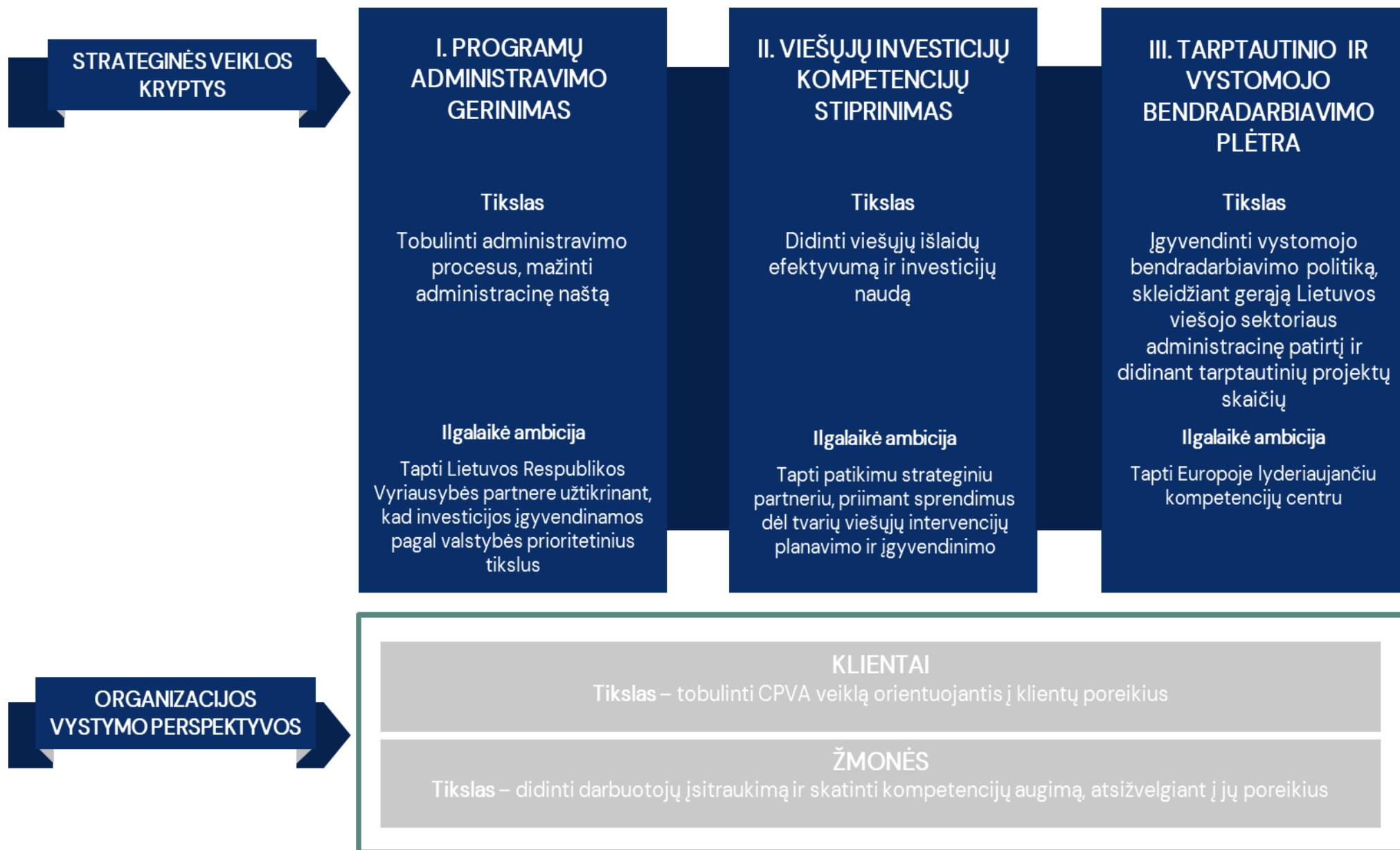
3 paveikslas. CPVA strateginės veiklos kryptys, organizacijos vystymo perspektyvos